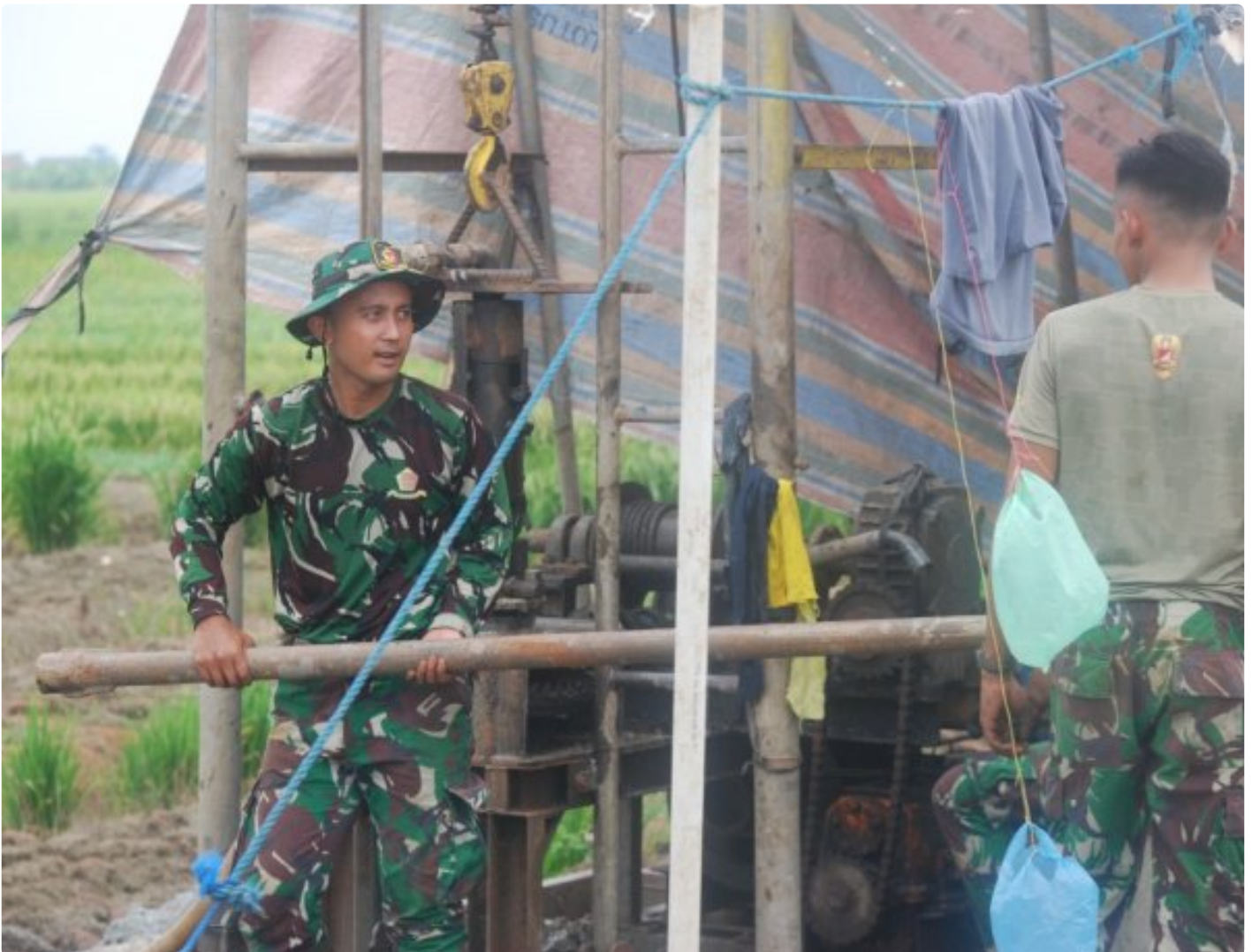
Proses pembuatan sumur bor oleh anggota satgas TMMD Kodim Demak

DEMAK - Program TNI Manunggal Membangun Desa (TMMD) Reguler Ke-123 Tahun 2025 Kodim 0716/Demak menunjukkan manfaat nyata bagi masyarakat.